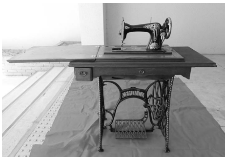
海外製足踏み式ミシン

奈良女子大学は、昭和初期に海外製足踏み式ミシンを複数台購入しています。戦前から実際の教育現場で使用されていた資料として貴重であるだけでなく、近代日本で販売されていた初期の海外製のミシン資料としても非常に価値の高いものです。近代日本では、明治期に富裕層から浸透し始めた洋装の文化とともに、ミシンおよびミシン教育が発展しました。奈良女子高等師範学校では、早くから授業に和裁だけでなく洋裁が取り入れられました。