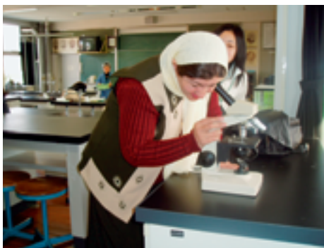
顕微鏡を用いての細胞観察 (附属中等教育学校)