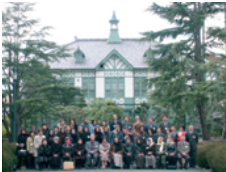
本学記念館前で記念撮影をする参加者と本学関係者

は一生の思い出です。生きている限り忘れません。ここで学んだこと経験したことをアフガニスタンで実践してゆきたい。」と感想が述べられました。