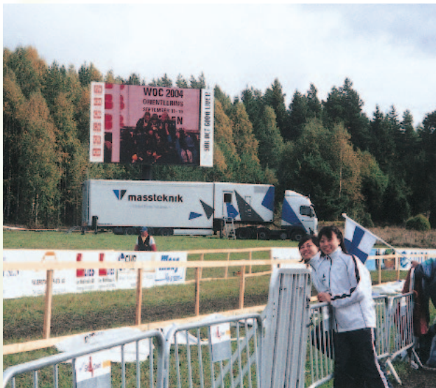
WOC閉会式後、スウェーデンの森と大型エキシビジョンをバックに

また遠征中に多くの人との出会いがあったこと、様々な文化を肌で感じる事が出来たことは、特に大きな収穫であった。