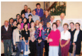
ファームステイ先で 留学生+ホストファミリー先と

オーストラリアの多文化教育に関する講義のトピックは、ジエスター、エスニシティ、多文化主義、アイデンティティ、白豪主義、先住民の文化など興味深い内容でした。チュ