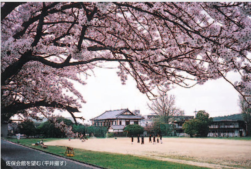
佐保会館を望む