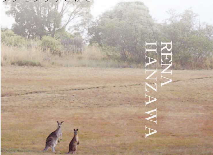
寮の前にいたカンガルーの親子

で多くの人に会いました。ジャパンプラブというサークルに入り、日本語を教えたり、日本食パーティーを企画したりして現地の学生達との交流を深めました。また、ロータリークラブが主催するファームステイに参加し、キャンベラとはまた違った環境で生活を体験することができました。寮の仲間とパーティーをしたり、スポーツ大会に参加したりして楽しい時間を過ごし、休みを利用してシドニーやメルボルンに旅行し、オーストラリアを満喫することができました。