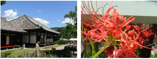
晩夏から初秋への奈良(奈良女子大学メールマガジンより抜粋)

科学研究費補助金申請の時期ですが、他助成公募についても数多く問合せがあります。研究協力課HPに随時掲載されていますが、紙面でも次ページ以降にご紹介いたします。